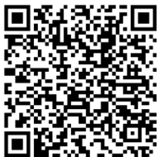
Link zur Pressemitteilung