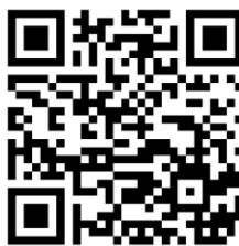
Informationen des Landes