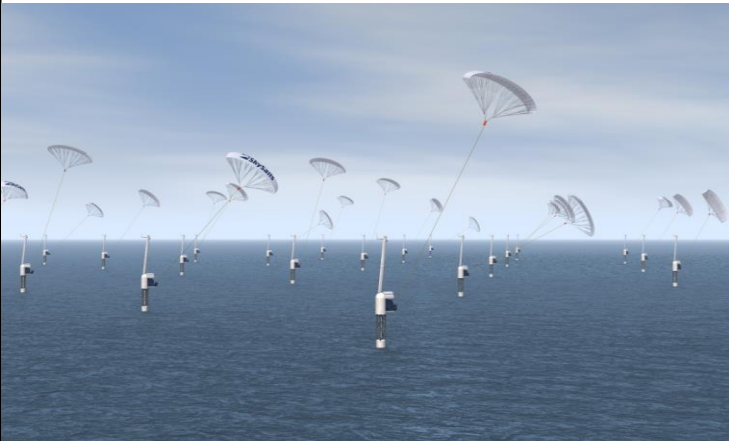
Internationaler Zukunftsmarkt: Offshore-Anlagen von SkySails Power