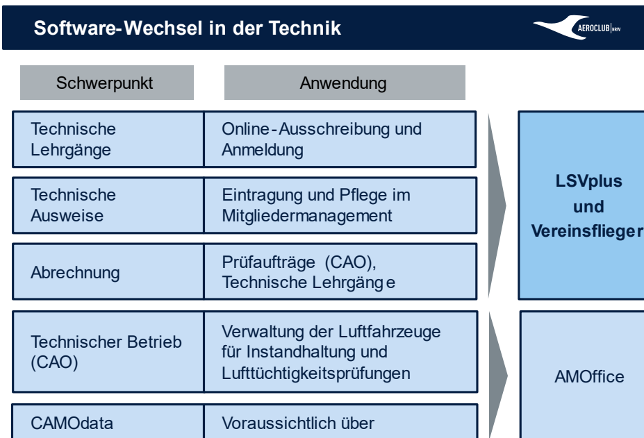
Abbildung 1: Übersicht der bisherigen Funktionen im Bereich Technik und der zugehörigen neuen Software.